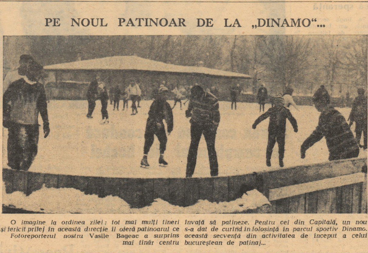
PE NOUL PATINOAR DE LA „DINAMO”...

Clasamentul final pe echipe: 1. Dinamo București 47 p, 2. Dinamo Brașov 38 p, 3. Mureșul Tg. Mureș 37 p, 4. Agronomia Cluj 30 p.