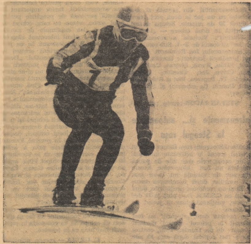
Iată-l pe cunoscutul schior francez Guy Perillat în plină cursă

redactor la „Ceskoslovensky sport” Praga