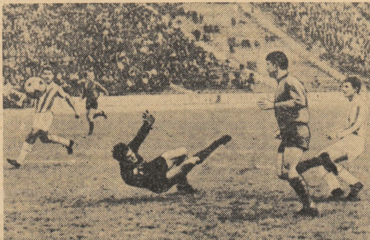
Minutul 84: Györfi înscrie punctul victoriei