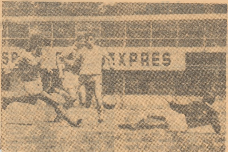
Un aspect din meciul Rapid C. F. București—Metalul Tirgoviste.

Rubrică redactată de Administrația de stat Loto-Pronosport.