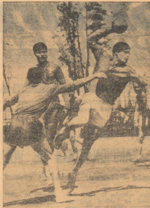
Un jucător de la Tehnometal a pătruns în semicerc și înscrie un nou punct în poarta rapidiștilor.