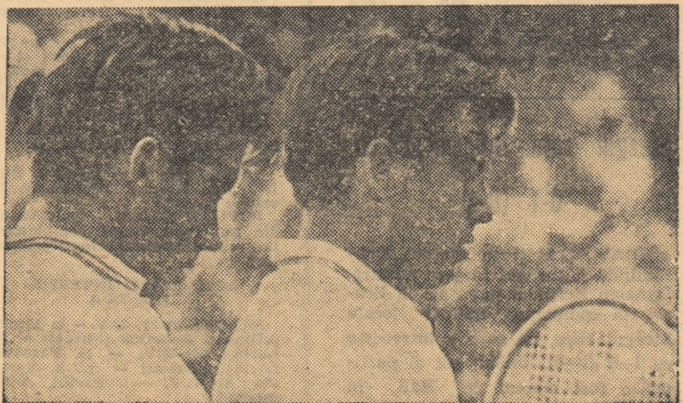
Santana și Arilla — învinși!

● Accesul publicului se va face pe baza contramărcilor biletelor de duminică.