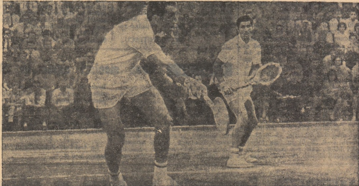
Ion Țiriac și Ilie Năstase în acțiune