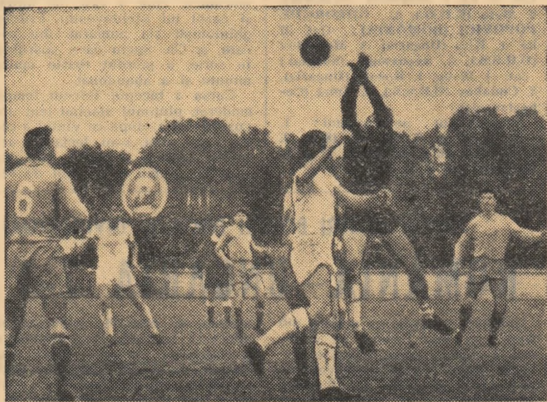
Atac la poarta formației din Galați. (Fază din meciul Dinamo Victoria—Siderurgistul)

OȚELUL GALAȚI — OLTUL RM. VILCEA 1-2 (0-1). Mai decisiv în acțiuni echipa de pe malul Oltului a deschis scorul în prima repriză prin Tăbircă (min. 39). Gazdele au obținut egalarea în min. 50 prin Pătrașcu, dar 3 minute mai târziu Udrea (Oltul) a adus victoria echipei sale. A condus cu competență C. Petrea — Buc. Meciul s-a desfășurat la Tecuci. (Vasile Doruș — coresp.).