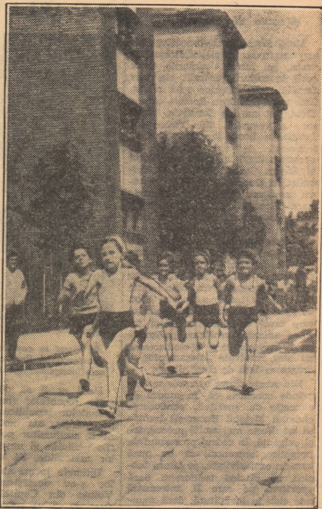
In plin efort, cele mai mici atlete de la asociația sportivă „Blocuri Ferentari”. Indirjita cursă de 30 m plat ure loc in cadrul tradiționalelor întreceri organizate in cinstea „Zilei copilului”.