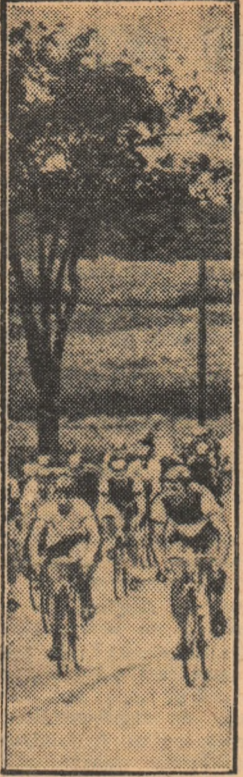
Plutonul, fragmentat din... necesități de pa-ginație, rulează susținut — cu direcția Brașov — în prima etapă a tradiționalei competiții