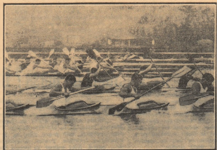
Start furtunos în cursa caiacelor de 4, la o ediție precedentă

Snagovul găzduiește azi și mîine — la cea de a X-a ediție a regatei internaționale — întrecerile unor valoroși caiaciști și canoiști din 10 țări europene. Vor lua startul sportivi din: România, Austria, Bulgaria, Cehoslovacia, Finlanda, Italia, Iugoslavia, R.D. Germania, R.S.F.S. Rusă și Suedia . În cele 10 echipe figurează — după cum am anunțat — numeroși laureați ai Jocurilor Olimpice, ai campionatelor mondiale și europene. Ceea ce sporește, desigur, interesul pentru ediția jubiliară a „Regatei Snagov”. Oaspeții au sosit la Snagov și, ieri, au făcut ultimele antrenamente. Atît sportivilor cît și antrenorilor care i-au însoțit sînt de părere că „Regata Snagov” este unul din cele mai importante examene pentru toți caiaciștii și canoiștii care și-au propus să ocupe locuri frunțase la „europenele” din august (Duisburg — R.F. a Germaniei). Programul competiției este următorul: SIMBĂȚA: 9-12 și 16-19; DUMINICĂ: 9-12 și 16,30-18,30. Așteptăm ca la aceste întreceri, ca și la celelalte competiții de amploare, caiaciștii și canoiștii români să facă dovada bunicii lor pregătiri și să se numere printre cîștigătorii probelor