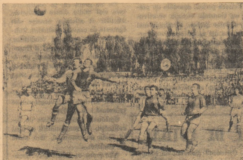
Fază din meciul Poiana Cimpina — C.S.M.S. Iași 0-3.

ETAPA VIITOARE (8 oct.): Metalul Hunedoara—C.F.R. Cluj, C.S.M. Sibiu — Minerul Baia Mare, C.F.R. Timișoara—Crișul Oradea, C.F.R. Arad—Politehnica Timișoara, A. S. Cugir Ind. sirm. C. Turzii, Gaz metan Mediaș—C.S.M. Reșița, Olimpia Oradea—Vagonul Arad.