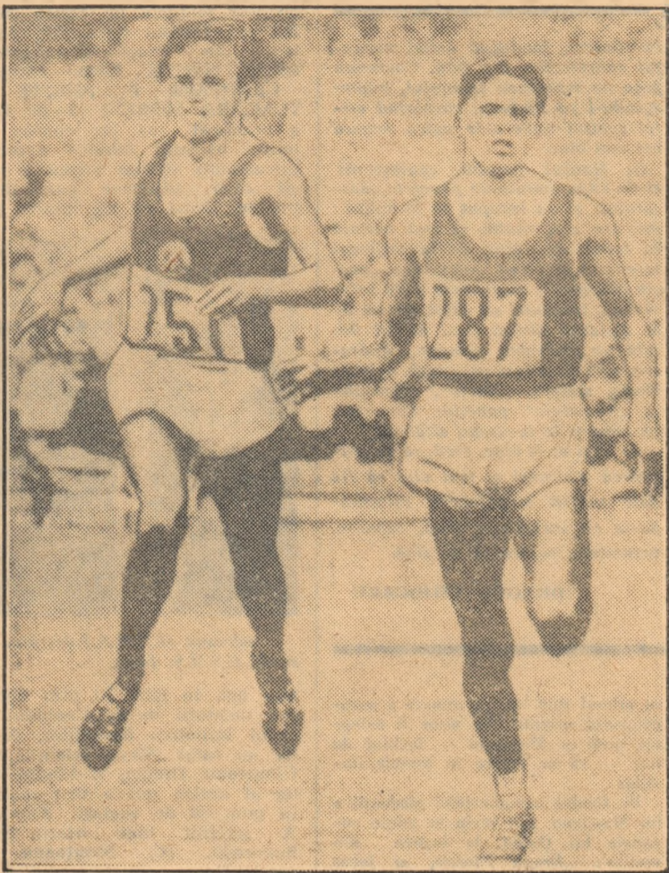
Sosire în proba de 10 000 m