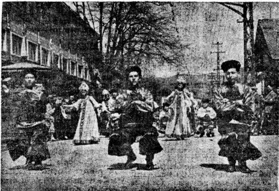
În fața tribunei, echipele de artiști amatori ale sindicatelor s-au opri și au executat cu multă măiestrie dansuri sovietice, românești și maghiare