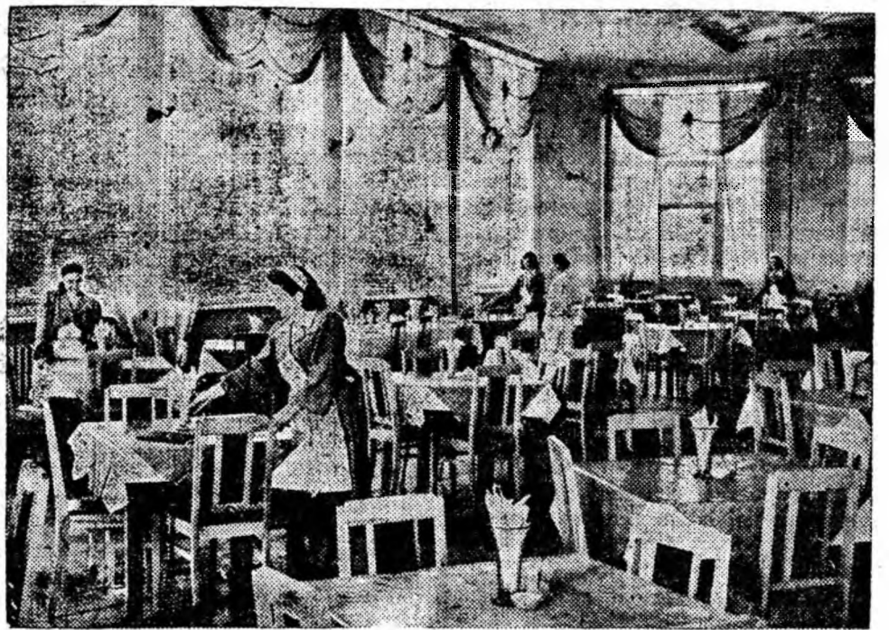
IN CLIȘEU: Interiorul cantinei din colonia muncitorească a uzinei Petros din Stalingrad

În sistemul asigurărilor sociale din Uniunea Sovietică sînt cuprinși toți muncitorii și funcționarii, fără excepție. Totodată oamenii muncii sînt scutiți total de orice fel de cotizații. Aceste cotizații le plătesc întreprinderile sau instituțiile. Așa dar, toate ajutoarele, pensiile și celelalte categorii de ajutoare de care beneficiază muncitorii, funcționarii și familiile lor în cadrul asigurărilor sociale reprezintă de fapt un supliment la salariu.