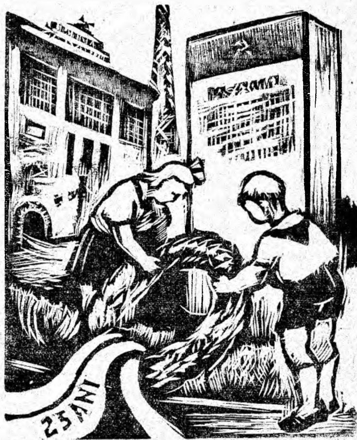
Gravură în lemn de H. MAKKAÏ PIROȘKA