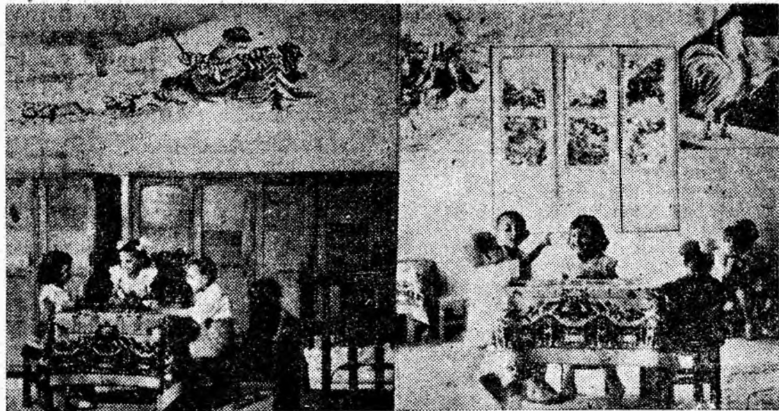
IN GLIȘEU: În căminul de zi pentru copiii muncitorilor sanitari din orașul Petroșani.