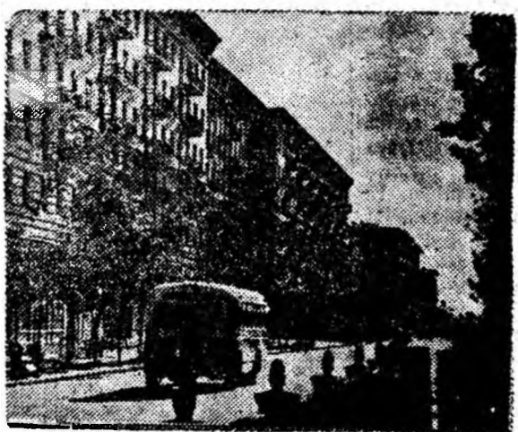
Frumoase cadouri au pregătit constructorii de la Stalingrad locuitorilor orașului-erou. Pe strada Lenin și pe Aleea Eroilor în ajunul aniversării lui Octombrie se vor da în folosință peste 300 de apartamente.

Pentru prelucrarea și industrializarea stufului, în septenal, se vor construi 6 mari combinate, două în Ucraina, câte unul în Kazahstan, Uzbekistan și Azerbaidjan. Noile combinate vor produce anual o cantitate de 500.000 tone celuloză și semiceluloză din stuf. În afară de celuloză, noile întreprinderi vor mai produce anual peste 50 milioane metri pătrați de plăci de stuf folosite în construcții.