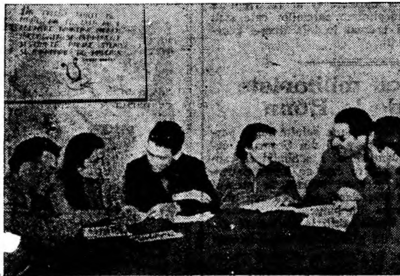
Artiștii amatori la o repetiție.

Deocamdată spectacolul se află doar la primele repetiții. El se înscrie în cadrul celui de-al II-lea Festival pe țară de teatru al amatorilor, „I. L. Caragiale”, care se va desfășura la sfîrșitul lunii ianuarie și începutul lunii februarie, anul viitor.