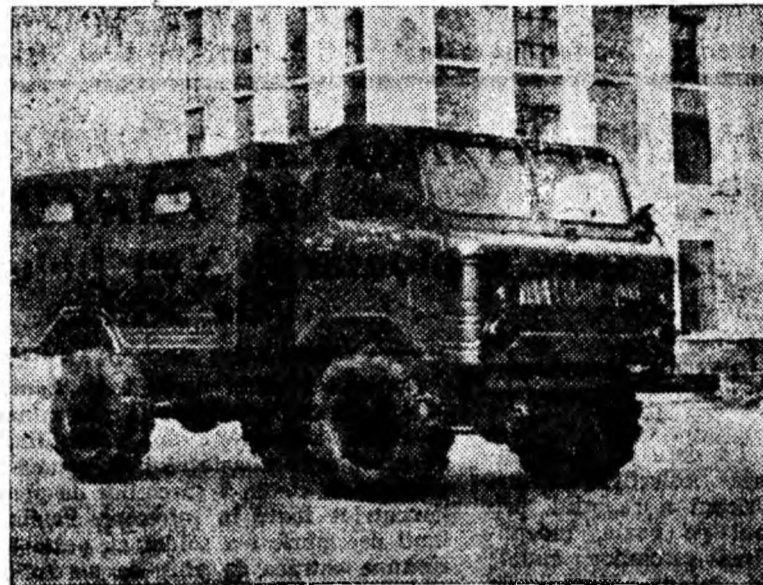
La uzinele de automobile din orașul Gorki, a fost construit un nou tip de autocamion de mare capacitate „GAZ-62”. Mașina are transmisie de tracțiune la ambele osii și cauciucuri antifărăpante. Consumul de combustibil este foarte redus.

Producția de carne a crescut de la 5,8 milioane tone în 1953 la 7,7 milioane tone în 1958. În primele 9 luni ale anului curent colhozurile și sovhozurile au sporit producția de carne cu încă 38 la sută. Producția de lapte aproape s-a dublat față de anul 1953.