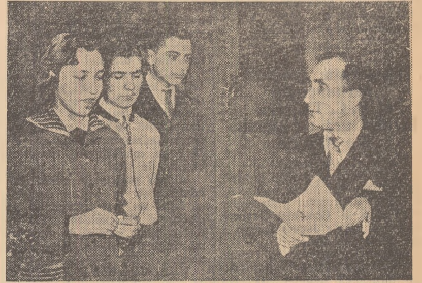
Un aspect de la concursul din Petroșani