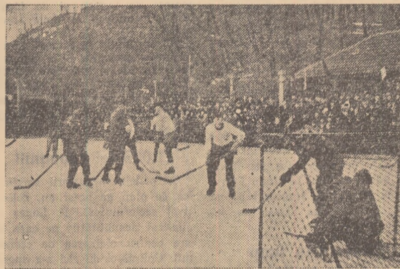
In clișeu: O fază din joc.

Intrecerile continuă luni și marți, cu probele de slalom uriaș, slalom special și fond.