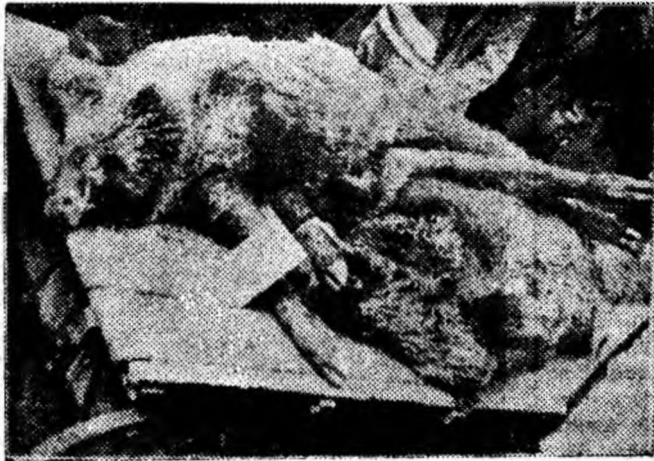
Frumoasă e regiunea noastră și bogată e flora și fauna ei! Pe piscurile golașe ale Retezatului, la înălțimi amețitoare caprele negre fac adevărate demonstrații de echilibristică. Vara în smeurșurile ce se găesc din belșug în munții ce împrejmuesc ca o cumină de lauri bogata Vale a Jiului, urșii mormăie sătui de dulciuri; iar când dă frigul se retrag, grași și mulțumiți, să hiberneze prin birloguri. Vulpi, iepuri, lupi, rîși, căprioare și multe alte animale întregesc bogăția faunei regiunii noastre. Zilele acestea au fost împușcați în împrejurimile comunei Pui, doi mistreți. Iată-i în clișeu sosiți în gara Petroșani de unde au fost trimiși spre frigorifer.