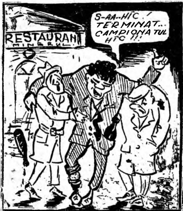
Turul campionatului categoriei B la fotbal s-a terminat. Jucătorii au intrat în vacanță. Numai Ciurdărescu de la Jiul își continuă antrenamentele. Deb! se străduiește omul să-și mențină „condiția fizică”.

În cursul unui examen radiologic, o tinăru iugoslavă a aflat că posedă patru rinichi, cite o pereche de flece parte a corpului; toți patru funcționează normal.