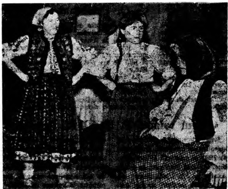
Asemenea scene, interpretate ireproșabil de artiștii amatori din Cîmpa au stîrnit nu odată, aplauzele spectatorilor bucureșteni, la scenă deschisă.