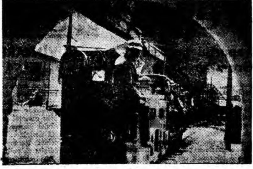
La intrarea în șut