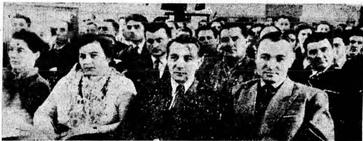
ÎN CLIȘEU: Aspect din timpul sesiunii.