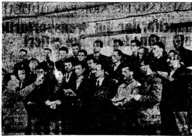
Corul bărbătesc din Petrila este cunoscut nu numai de spectatori din localitate ci și de cei din toate localitățile Văii Jiului. Iată în clișeu de față o parte din cei 100 de coriști la o repetiție, pregătindu-se pentru faza orășenească a celui de-al VI-lea concurs.

Intr-o parte a holului clubului din Petrila un grup de băieți și fete ascultau cu atenție vorbele unuia dintre ei. Hohotele de ris care se auzeau la intervale scurte