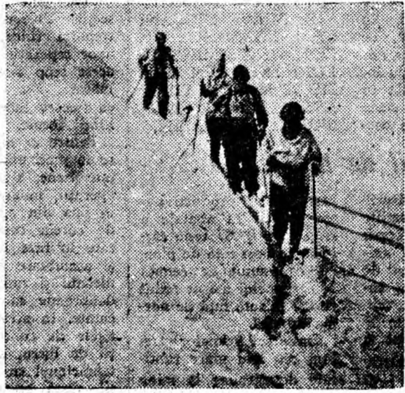
Întoarcerea la cabană

Traversarea Retezatului poate fi făcută și în sens invers. Pornind cu trenul din Petroșani, excursionistul coboară la Ohaba de sub piatră și trecînd prin satele Sălașul de jos și Sălașul de sus, ajunge la Nucșoara care, la fel ca și Cîmpu lui Neag,