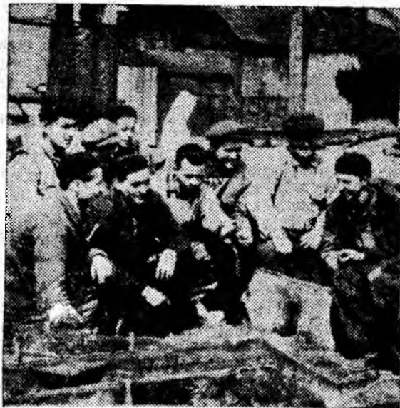
Sute de tineri din Valea Jiului participă la acțiunea patriotică de colectare a fierului vechi. Tinerii din sectorul VI Lonea au colectat zilele trecute 8.000 kg. fier vechi.

mentului cu mult înainte de termen. După 5 zile de muncă din aprilie depășirea față de plan se ridică la 62.507 tone de cărbune (s-au extras peste plan în aceste cinci zile 1422 tone cărbune). Cu excepția minei Lonea toate celelalte colective și-au depășit sarcinile de plan la zi. În frunte sînt minierii de la Petrița care au dat deja 911 tone de cărbune peste plan, apoi cei de la Urșani cu 516 tone de cărbune peste plan; cei de la Aninoasa, Lupeni, Vulcan.