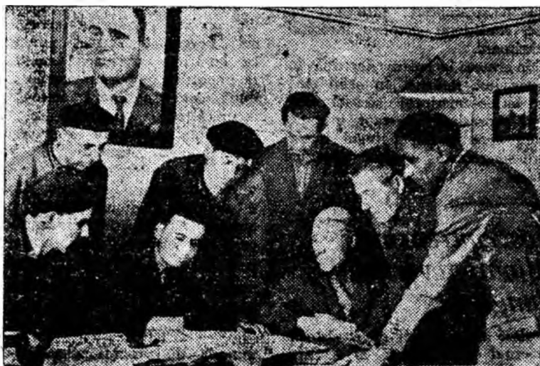
În jurul șefului uzinei s-au adunat câțiva dintre cei mai buni muncitori și maeștri. Se discută planul de acțiune pentru creșterea potențialului uzinei.