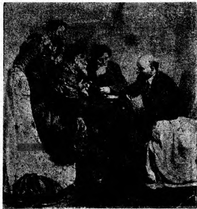
Întîlnire cu V. I. Lenin

Poporul nostru muncitor a ajuns pe culmea de pe care vede cu toa-