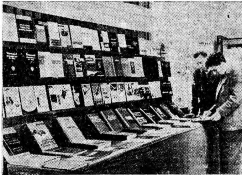
Cartea tehnică a fost întotdeauna un ajutor prețios al muncitorilor, tehnicienilor și inginerilor, în ridicarea calificării lor. La toate bibliotecile din Valea Jiului, colțul cărții tehnice este cel mai bogat. Iată, de pildă, în clișeu de față un stand de cărți tehnice amenajat la clubul A.S.I.T. din Petroșani.