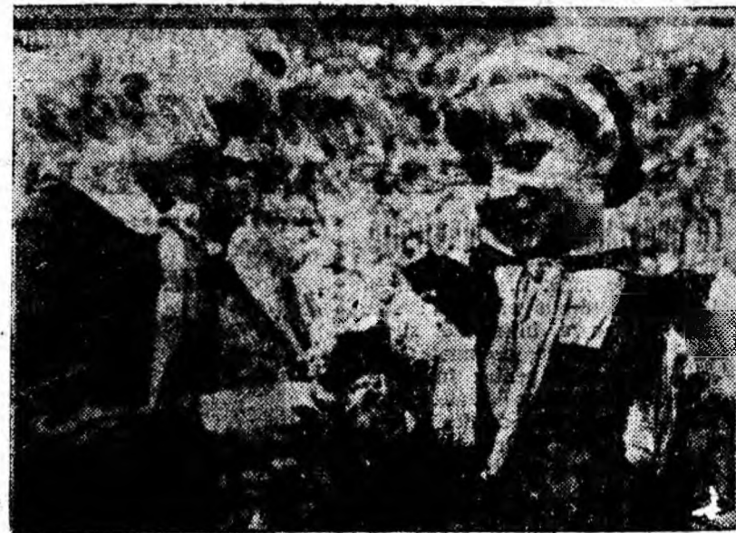
Un buchet de flori.