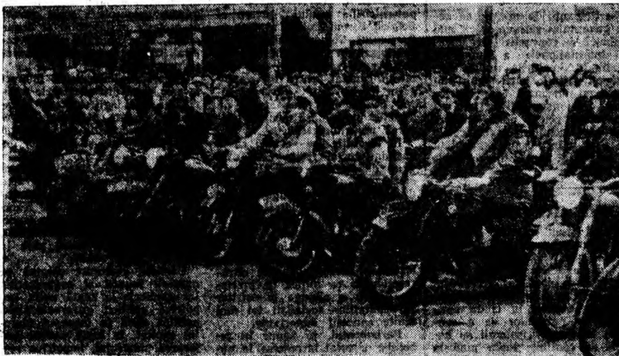
Start! Motocicliștii din Petroșani sînt gata de drum pentru a porni spre Deva. Ei au purtat solia minerilor din Valea Jiului, în cadrul ștafetei organizate acum citeva zile: „Ștafeta 8 Mai”. ÎN CLIȘEU: Înainte de plecare.

Colectivul sectorului nostru va lupta și pe mai departe cu mai multă hotărîre pentru a extrage cărbune de calitate cît mai bună.