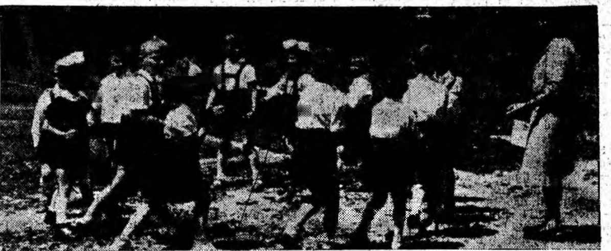
Jocul în aer liber este cel mai atrăgător punct din programul zilnic al copiilor de la grădinița din Petrila. Îndeosebi în ultimele zile datorită ploilor nesfîrșite fiecare minut cu soare este folosit din plin. Pentru azi educatoarea învață copiii dansul „Joacă, joacă”. Copii au și început să se înscriească în ritmul lin al melodiilor.