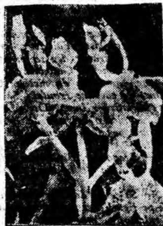
Grăția zorilor — una din speciile rare ale florei munților Retezat.

Dintre munții regiunii Hunedoara cel mai frumos și mai interesant este masivul Retezat. Coloritul peisajelor, cele 80 de lacuri glaciare și raritatea unor specii floristice și faunistice dau tîmbului o notă cu totul aparte. Datorită interesului științific și pitorescului pe care îl prezintă, o mare suprafață din zona centrală a acestui masiv a fost declarată în anii regimului democrat popular, parc național de rezervație naturală. Aici, în ascunzul pădurilor, în poieni ca și în mediul stîncos al înălțimilor alpine își găsesc găzduire și ocrotire un