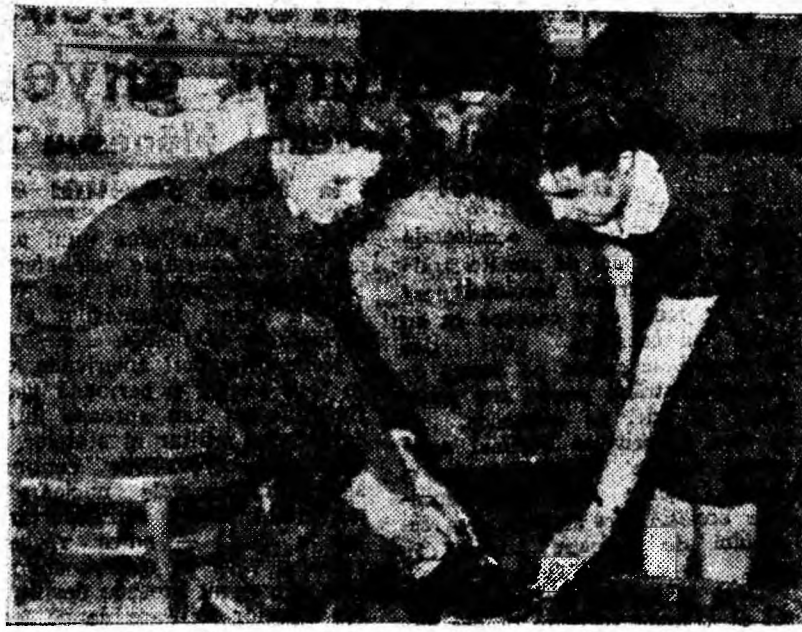
Personalul unității 29 în călăminte Lupeni a încheiat trimestrul III al anului cu o depășire de plan de peste 20.000 lei. La baza succeselor obținute a stat buna deservire a cliențelii.