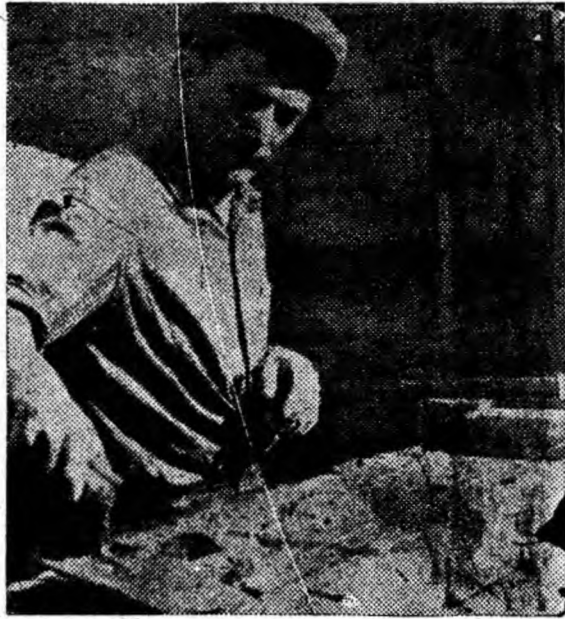
Zilele frumoase ale toamnei sînt folosite din plin pe șantierul celor 5 blocuri din strada C. I. Parbon — Petroșani. Angajamentul constructorilor de aici este să termine pînă la sfîrșitul anului 100 apartamente. Au fost ridicate deja trei blocuri, iar acum se înalță zidurile la al 4-lea.

Dr. ALDICA NICOLAE directorul Policlinicii Lupeni