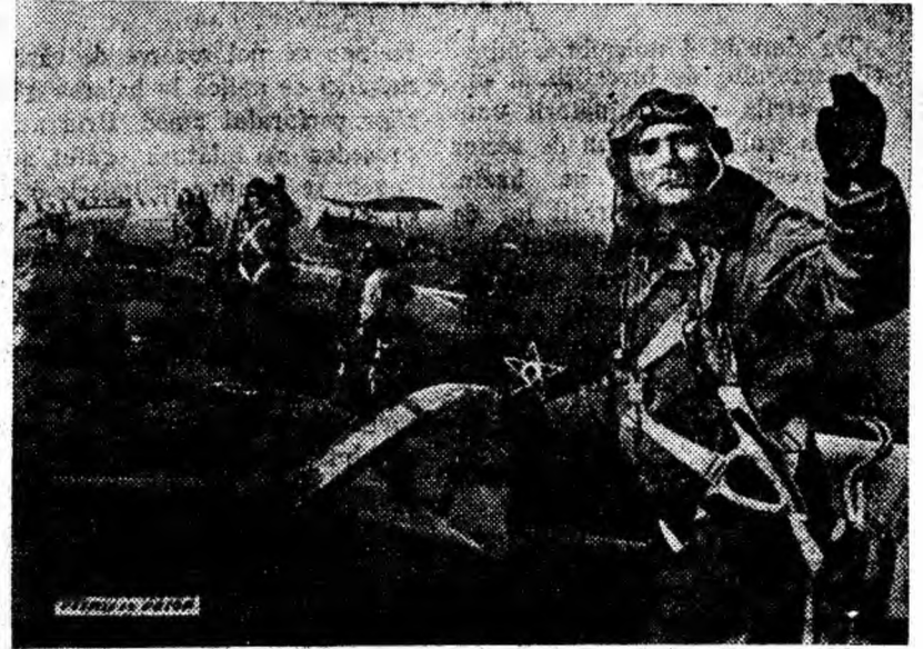
ÎN CLIȘEU: Un cadru din filmul „Patru în potop”.

de un elev mai mic, Karcsi, Peter pleacă să o salveze pe Kati. Cei trei găsesc un camion la marginea șoselei și ajung cu bine la cabană în care Kati aștepta întoarcerea tatălui ei de la vîntoare. Acesta, alarmat și el de apropierea apei Dunării, vine prea tîrziu și nu mai găsește pe