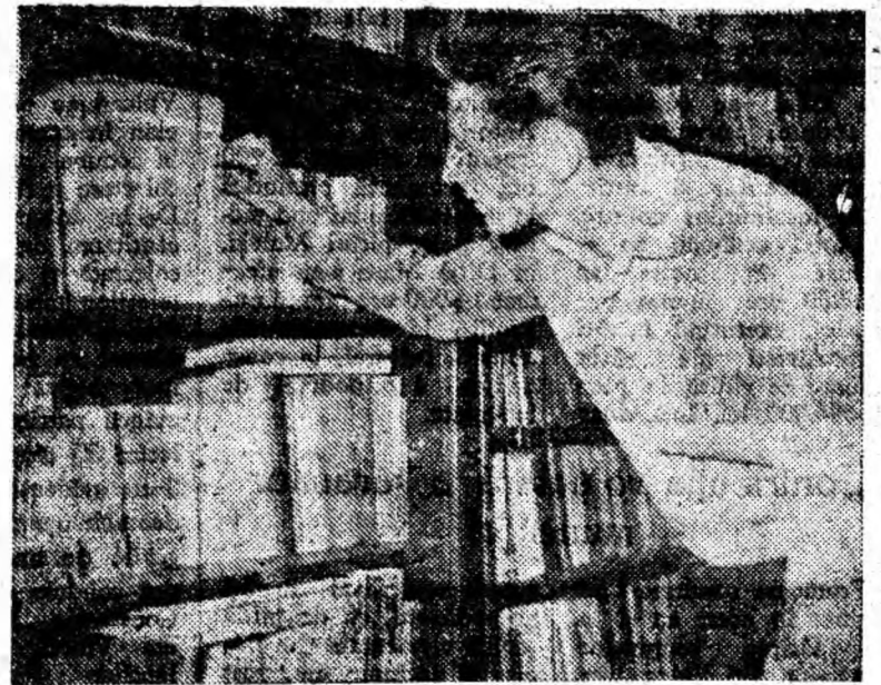
O carte bună — e prietenul și sfătătorul cel mai bun. Aspect cotidian de la bibliotecile din Valea Jiului.

Sondorii, mecanicii, geologii întreprinderii, îndrumați de cei mai buni dintre ei, comuniștii, lucrînd cu utilaje moderne de forat și cercetare, au obținut realizări însemnate în răstimpul trecut din acest an. Este de a-