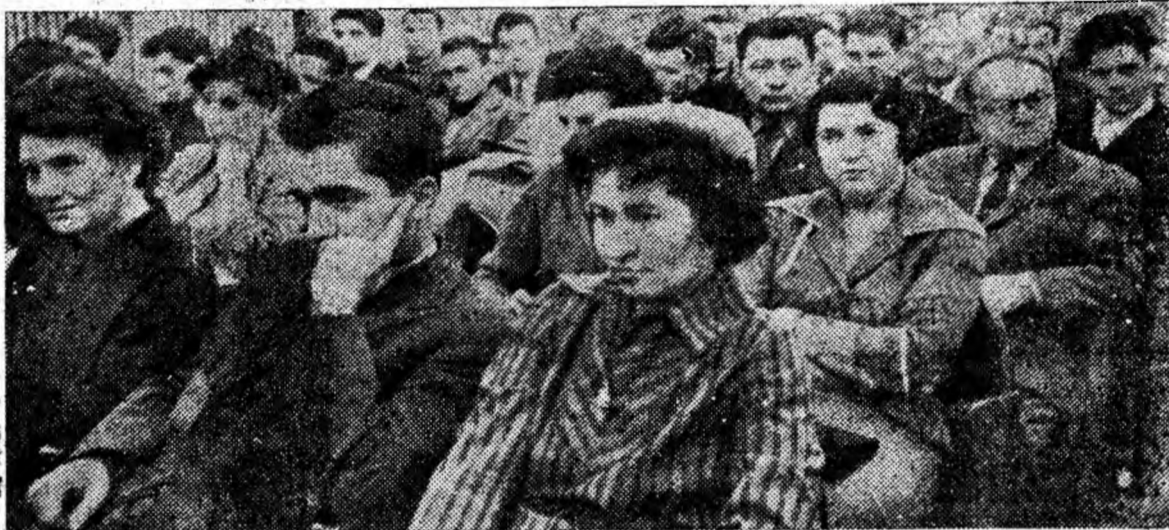
IN CLIȘEU: Aspect din timpul conferinței.

Miercuri după-amiază, la Petroșani, au avut loc lucrările conferinței orășenești U.C.F.S. Petroșani.