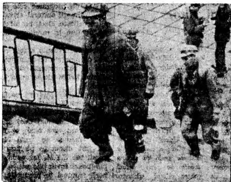
Pe aceste scări urcă zilnic mii de mineri din Lupeni, în drum spre mină.