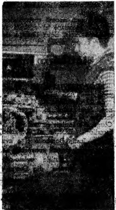
În atelierul mecanic al termostentralei Paroșeni lucrează tînărul fressor Dornik Tiberiu. Întă-l preocupat cu confecționarea sticlelor de nivel pentru cazane.