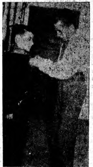
Încă o steluță — încă o distincție pe plectul unui plomfău.

Expunerea a fost ascultată cu viu interes de cei prezenți și în repetate rînduri a fost subliniată de aplauze. Adunări asemănătoare au mai avut loc și în alte întreprinderi și instituții din localitățile Văii Jiului.