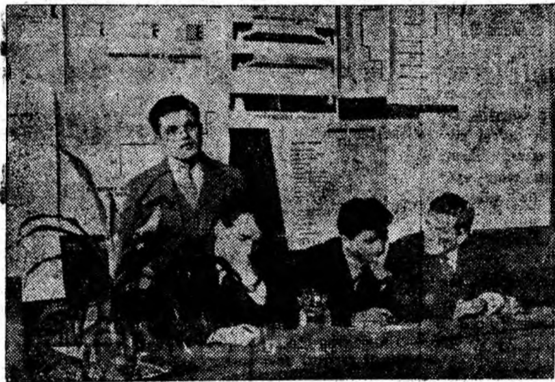
Aspect din timpul sesiunii.

• În cadrul colaborării științifice între Institutul de mine și alte institute tehnice din țară, la actuala sesiune un colectiv de studenți de la politehnica din Cluj, a prezentat o interesantă lucrare în domeniul mecanicii. Cu acest prilej studenții clujeni au vizitat și Valea Jiului.