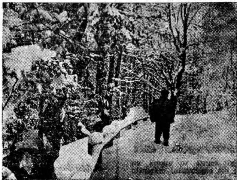
Pe drumuri înzăpezite de munte.

• Alpinștii din R.S.S. Kazahă au dat numele de „Julius Fucik” unui virf de 4000 m. din munții Ala-Tau. Pentru a cinsti memoria acestui erou al poporului cehoslovac, alpinștii au montat pe virful muntelui o placă comemorativă pe care sînt scrise ultimele cuvinte ale lui Fucik: „Oameni, eu v-am iubit. Fiți vigilenți!”.