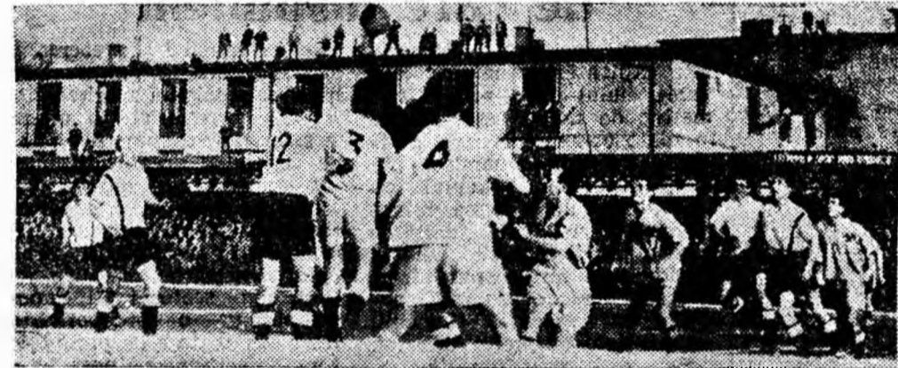
Fază de la poarta Minerului

e rotund" nu s-a dezmințit nici de astădată.