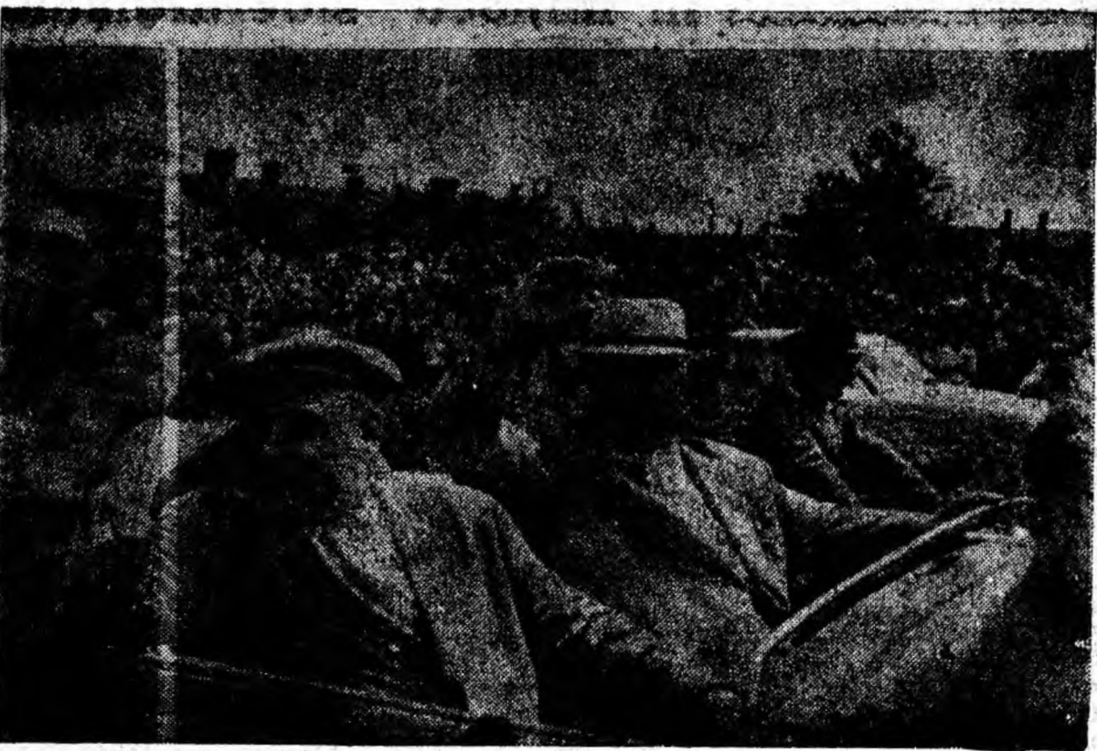
Pe străzile Hunedoarei