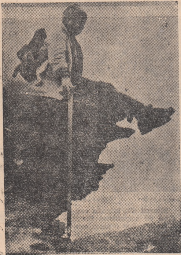
Un „turist” la înălțime.

Că doarme-n exercițiul funcțiunii E lucru vechi, nu-l pentru prima oară. Dar să nu faci ochii mari de se trezește Zburat cu pat cu tot din slujbă afară.