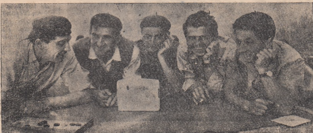
Concertele sint mult îndrăgite de tinerii mineri din Uricani. Iată în clișeu un grup de tineri mineri de la sectorul II al minel Uricani surprinși de ziarului în timpul unei audiții.

P.S. Titlul nu corespunde întocmai realității. E adevărat că e ultimul lor șut... dar înainte de concediu. După aceea din nou la treabă cu forțe sporite.