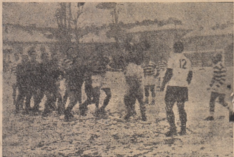
O fază a jocului