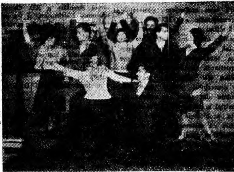
Moment coregrafic de la o repetiție cu opereta „Vint de libertate” pusă în scenă de artiștii amatori ai clubului muncitoresc din Petrila.