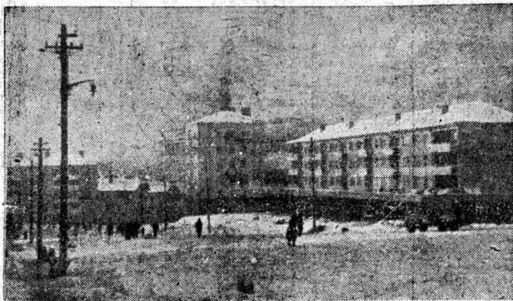
Îată un peisaj de iarnă din cartierul de blocuri Viscoza Lupeni; se zăresc siluetele noului bloc-magazin precum și ale blocurilor C și D, date în folosință în cea de-a doua jumătate a anului trecut.