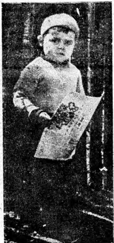
Sînt încă mic și n-am pătruns în tainele literelor, dar tare mă vrea să știu ce scrie în foaie...

„Conducerea O.C.L. Alimentara din Petroșani ar combate practica folosită de personalul centrului de pine din cartierul Gh. Dimitrov de a ține închis centrul cite 30—40 minute în ore de vîrf, chipurile, pentru preluarea mărfii.