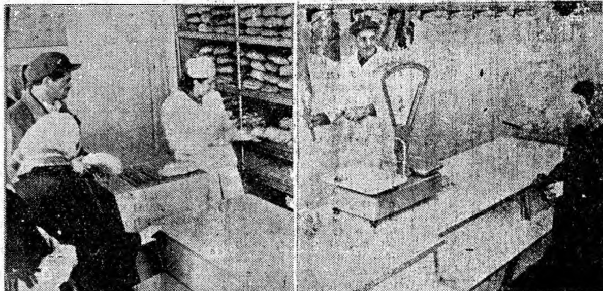
La parterul blocurilor de pe strada Constructorul din Petroșani, înălțate în ultima vreme, au fost deschise unități comerciale noi, cu aspect modern, igienic. Iată două din aceste unități: magazinul de pîine și măcelăria.

un concurs literar-istoric pe tema Unității principatelor, precum și recenzii pe marginea romanelor „Risipitorii” și „Întreaga țară un imens șantier” și altele. La aceste acțiuni au participat peste 350 de tineri.