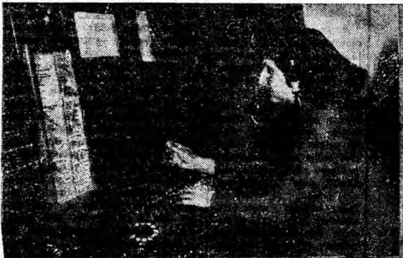
IN CLIȘEU: Operativ, conștiincios...

Alături de celelalte unități feroviare din complexul C.F.R. și micul colectiv de telefoniste își aduce aportul la îndeplinirea planului de transport. Aici realizările sînt rodnice. Lună de lună planul