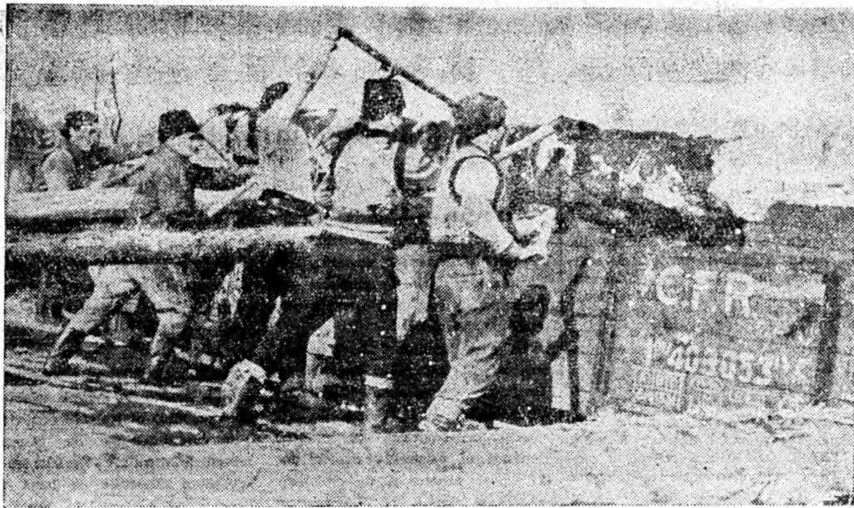
Zilnic, din gara Bănița numeroase vagoane încărcate cu bușeni de fag iau drumul spre diferite unități de prelucrare a lemnului. Cliseul nostru înfățișează un aspect din operația de încărcare a bușenilor de fag în vagoane.

Realizările obținute în îmbunătățirea calității cărbunelui în acest an la mina Petrila sînt rodnice. Și pentru ca aceste realizări să fie și mai bogate este necesar ca inițiativa „Nici un vagonet de cărbune rebutat pentru șist” să fie extinsă la toate abatajele minei. Aceasta cu atît mai mult cu cît s-a văzut că acolo unde inițiativa se aplică într-adevăr, rezultatele dobîndite în îmbunătățirea calității producției sînt îmbucurătoare.