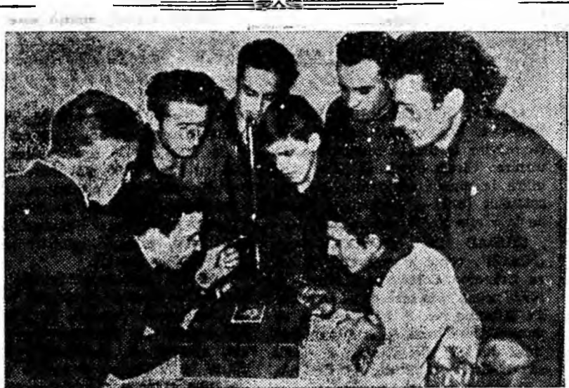
Printre cercurile care-și desfășoară activitatea la clubul muncitoresc din Vulcan, se numără și eel de foto. La acest cerc zeci de tineri sînt inițiați în arta fotografiei. Ei au la dispoziție aparatele necesare. ÎN CLISEU: La o oră de laborator, de la cercul de foto de pe lângă clubul muncitoresc din Vulcan