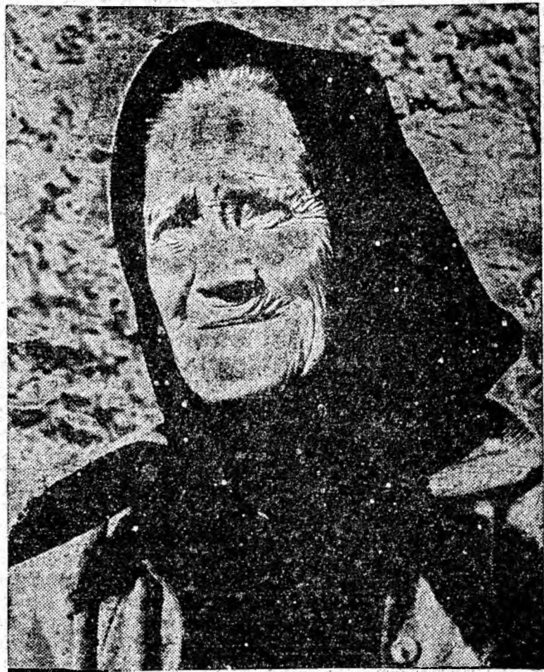
Un cadru din filmul „Lupeni 29”.

Realizatorilor filmului „Lupeni 29” le-au fost înmîinate buchete de flori din partea minerilor.