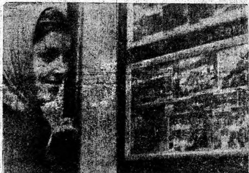
Fotografiile noi au apărut pe panoul preparației Lupeni, panou care ilustrează în imagini petrecerea plăcută și totodată utilă a timpului liber de către colectivul preparației.

Excursie la Uricani cu sîniere în munții încotoșmănați în pufoasa mantie a iernii; vizionări colective de filme și spectacole — sînt doar cîteva din mijloacele de recreare folosite de muncitorii, tehnicienii, inginerii și funcționarii preparației, și redată în fotografiile de pe panou.