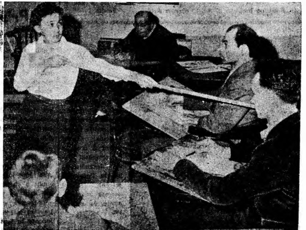
ÎN CLISEU: Atmosferă de lucru în atelierul artiștilor plastici amatori din Lupeni.