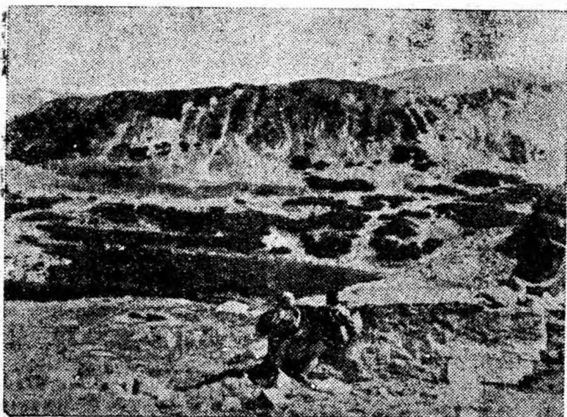
Culmile Parîngului cu peisajele lor pitorești sînt străbătute de tot mai mulți excursioniști, iubitori ai naturii. ÎN CLISEU: Scurt popas în preajma unui lac de sub virful Mîndra.